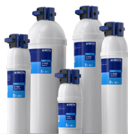
PURITY C Quell ST