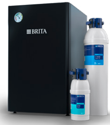
BRITA PROGUARD Coffee

Uitstekende en consistente waterkwaliteit zonder installatie van filtertechnologie