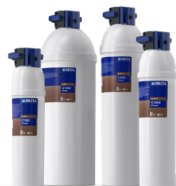
PURITY C Finest