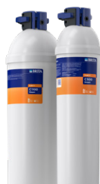
PURITY C Steam