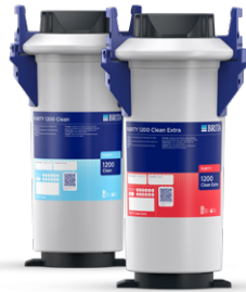
PURITY Clean/ PURITY Clean Extra

Beleef een pure koffie-ervaring en fris water voor heerlijke warme koffie