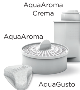
AquaAroma Series/ AquaGusto

Gedeeltelijk/volledig gedemineraliseerd water voor eersteklas wasresultaten